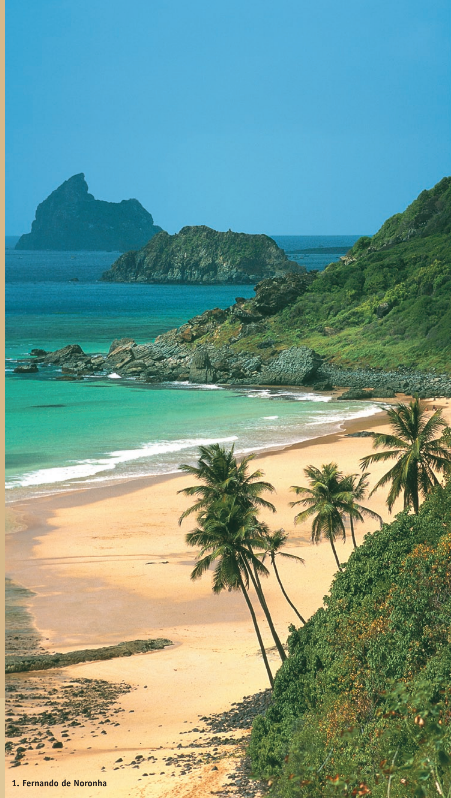
1. Fernando de Noronha

Los restos de la Mata Atlántica se pueden encontrar en pequeños parques y reservas privadas. Importantes iniciativas de conservación costera incluyen la isla volcánica de Fernando de Noronha, Isla de Itamaracá, Mamanguape y TAMAR.