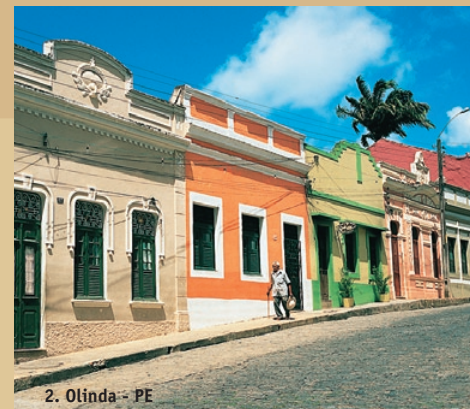
2. Olinda - PE