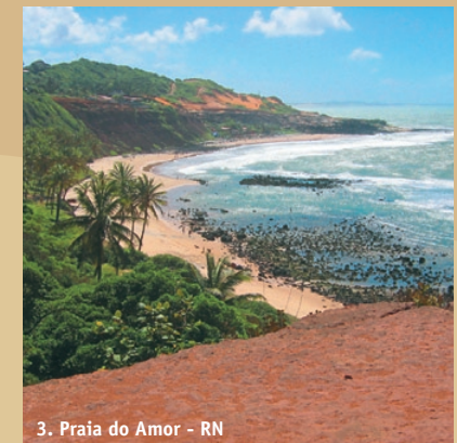
3. Praia do Amor - RN