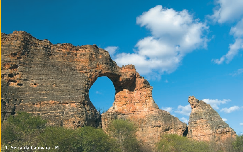
1. Serra da Capivara - PI

T he sertão, the arid badlands of the northeast, is timeless and tough. Amongst the scraggy rocks, round boulders, thorny shrubs and giant cacti, you can find traces of Gondwana land, dinosaurs, megafauna and ancient peoples that vanished long ago. The fierce Cariri Indians once ruled here and, much later, the famous outlaw Lampião.