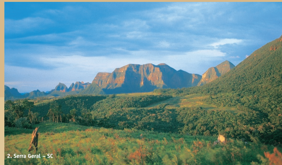
2. Serra Geral – SC