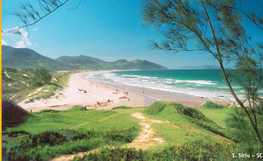
1. Siriu – SC

S urf, snow, rainforest and hot springs. With a wide range of natural attractions and European overtones in its culture, Santa Catarina is a compact land of delightful contrasts with the vibrant island and beach city, Florianopolis, as its capital.