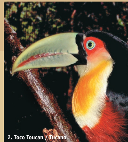
2. Toco Toucan / Tucano