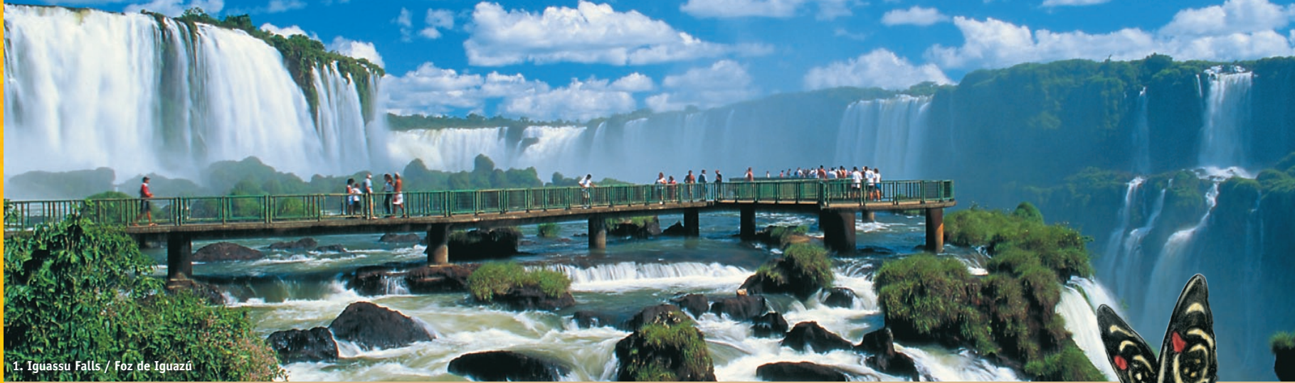
1. Iguassu Falls / Foz de Iguazú

One of the grand spectacles of nature is found at the Triple Frontier of Brazil, Argentina and Paraguay: Iguassu Falls. Its dimensions and magical rainforest setting make this “big water” (translation from guarani: Igua-açu) one of the most beautiful and overpowering waterfalls in the world.