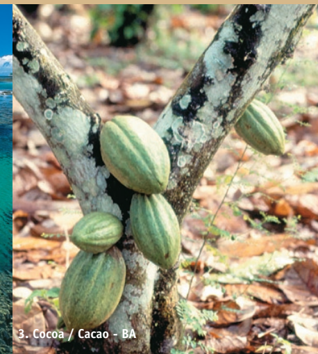
3. Cocoa / Cacao - BA