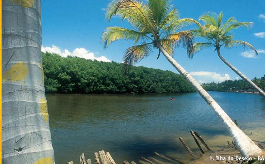
1. Ilha do Desejo - BA

C olonial Camamu (f. 1560), once the capital of manioc flour production, oversees the third largest bay in Brazil. From its small, but busy, port boats set out to small towns tucked away in the mangrove-lined bay like Cajaiba, with its old style shipyard or to Barra Grande at the tip of the Marau peninsula, the regions main tourism center. Taipus de Fora, one of Brazil's top beaches with an enormous natural reef pool, is just of the many tranquil beaches you can explore from here.