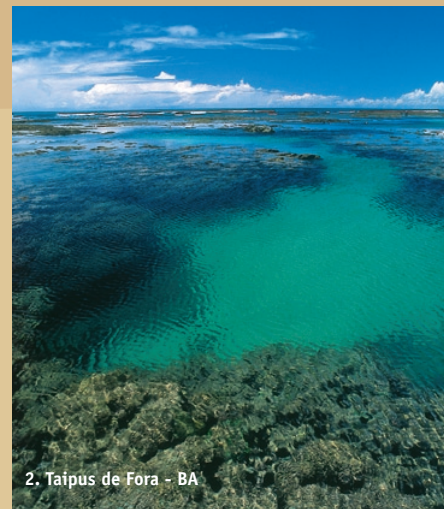
2. Taipus de Fora - BA