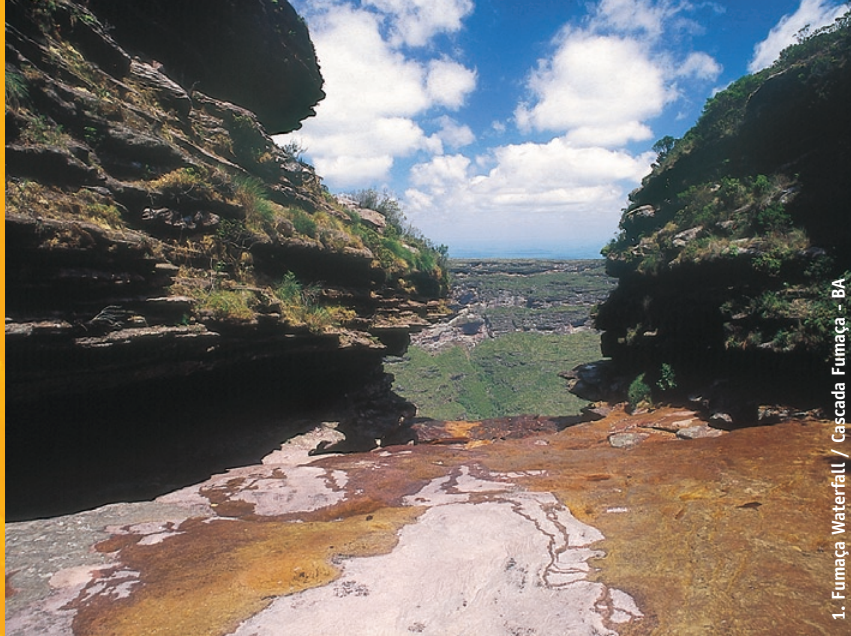
1. Fumaça Waterfall / Cascada Fumaça - BA

S pectacular scenery of imposing canyons and table mountains, flowing grasslands and forested valleys, extensive cave systems, many waterfalls and deep swimming pools in the heart of the state of Bahia.