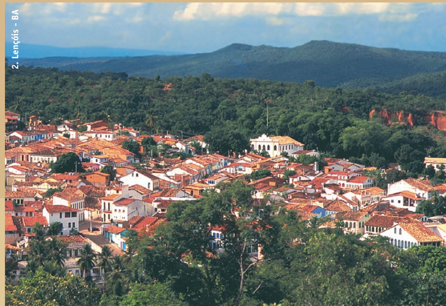
2. Lençóis - BA

Lençóis, su puerta de entrada, es de fácil acceso por aire o por tierra desde Salvador. Es estupendo visitar la Chapada a lo largo de todo el año y hay buenas guías impresas, hoteles, tiendas y guías acompañantes.