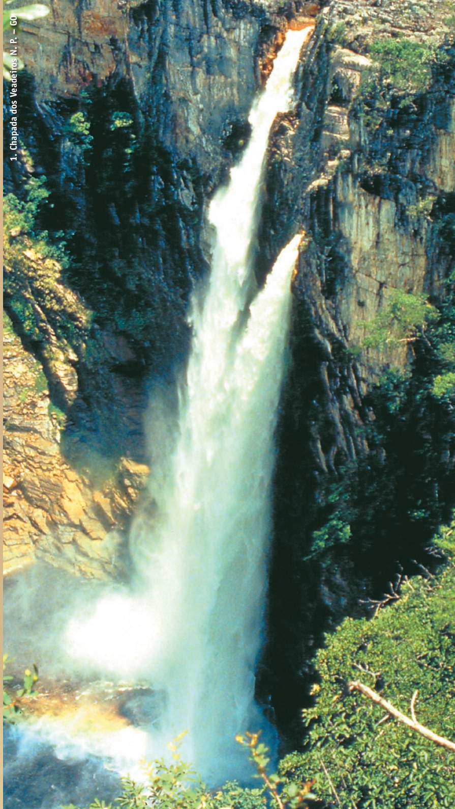
1. Chapada dos Veadeiros N. P. — GO